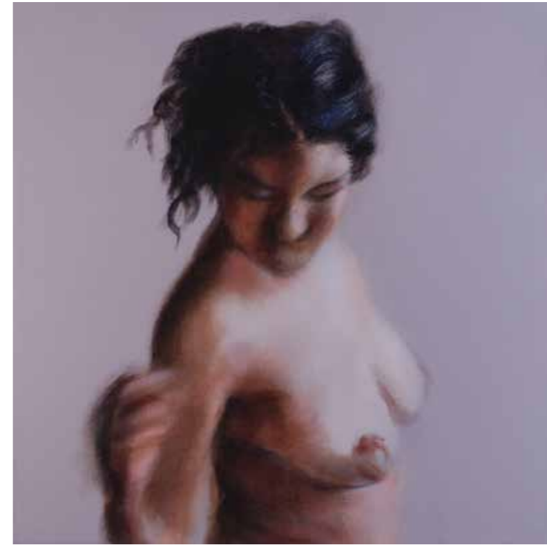
Cat. 25 Liliana Ang Torso no. 17 2008 Acrílico sobre tela 60 x 60 cm