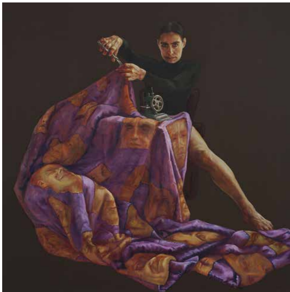
Cat. 4 Carmen Chami Gertrudis Bocanegra como pretexto 2010 Óleo sobre tela 120 x 120 cm