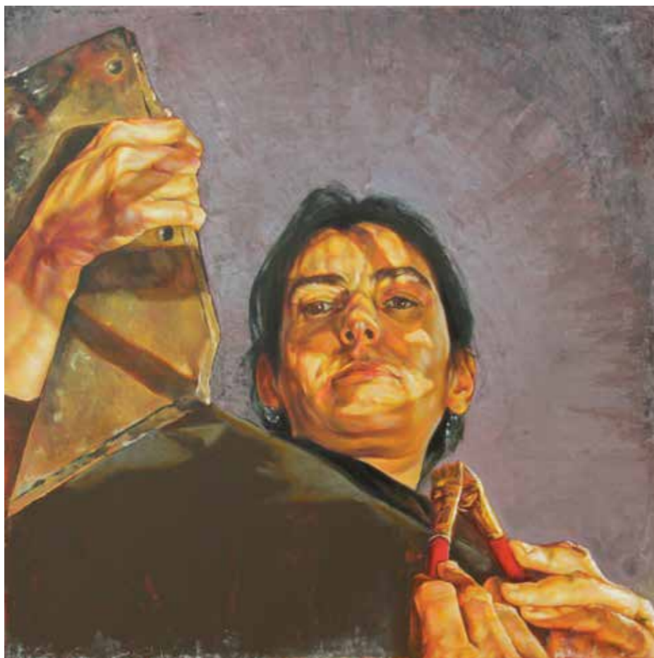
Cat. 1 Carmen Chami Reflection I 2012 Óleo sobre tela 80 x 80 cm