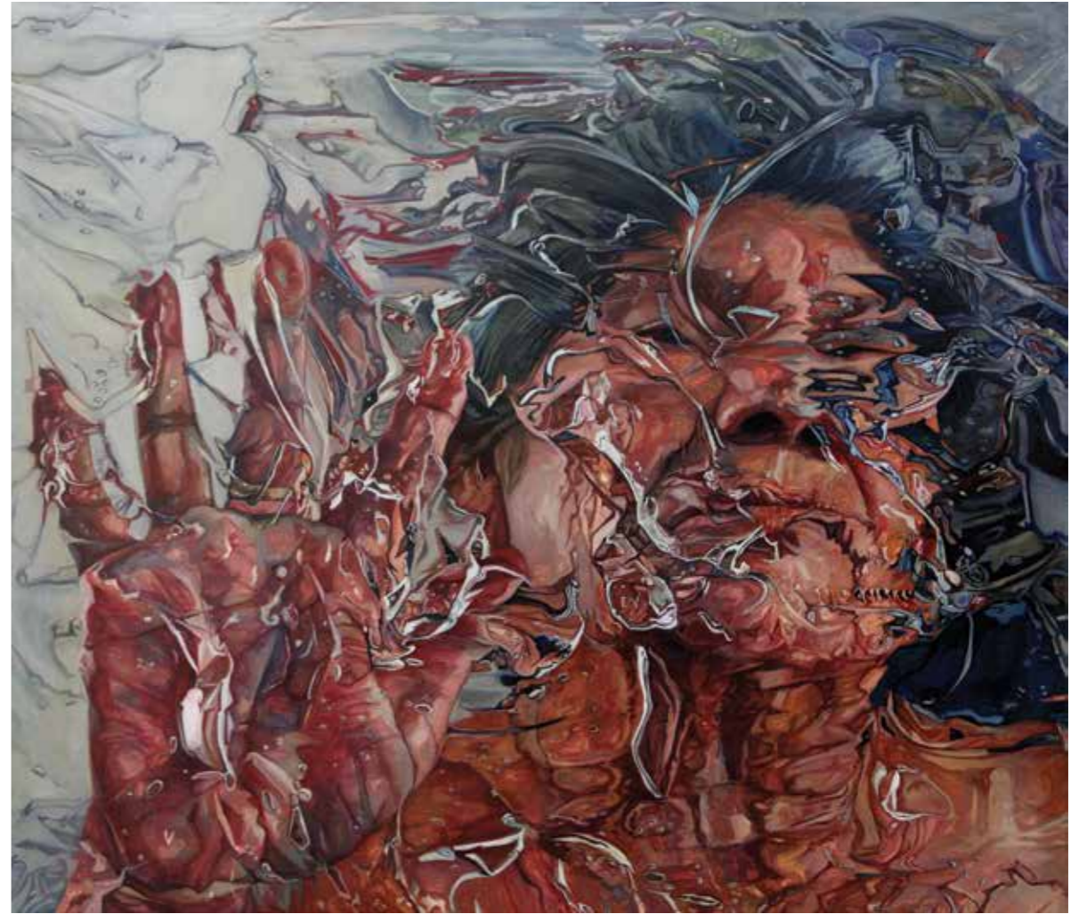
Cat. 17 Paulina Jaimes Diseminación familiar I 2014 Óleo sobre tela 140 x 160 cm