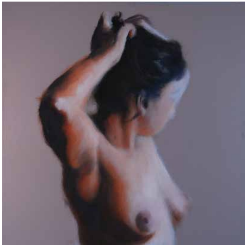
Cat. 24 Liliana Ang Torso no. 10 2008 Acrílico sobre tela 60 x 60 cm