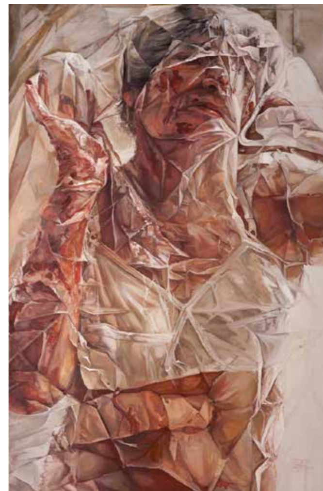
Cat. 20 Paulina Jaimes Esther 2012 Óleo sobre tela 150 x 120 cm