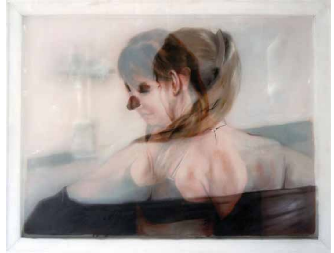
Cat. 7 Sandra del Pilar Máscara 2015 Óleo y acrílico sobre manta y tela sintética 45 x 70 cm