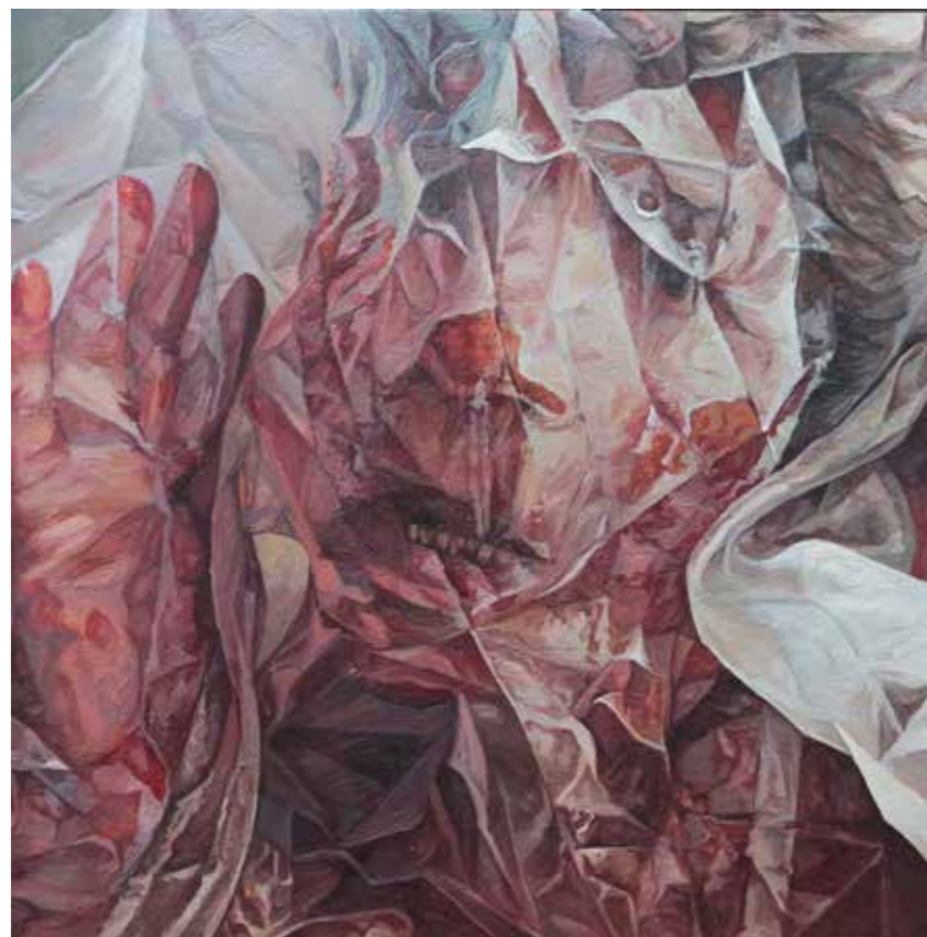
Cat. 19 Paulina Jaimes El velo 2012 Óleo sobre tela 80 x 79.5 cm