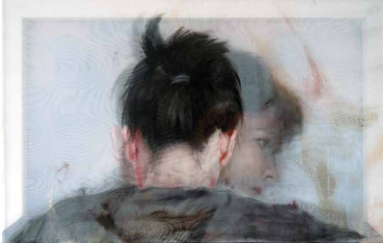
Cat. 6 Sandra del Pilar Desdoblamiento del sueño 2015 Óleo y acrílico sobre manta y tela sintética 45 x 70 cm