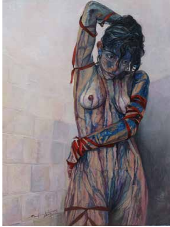
Cat. 16 Paulina Jaimes Cuerpo y espacio II 2014 Encausto sobre madera preparada con caseína 40 x 30 cm