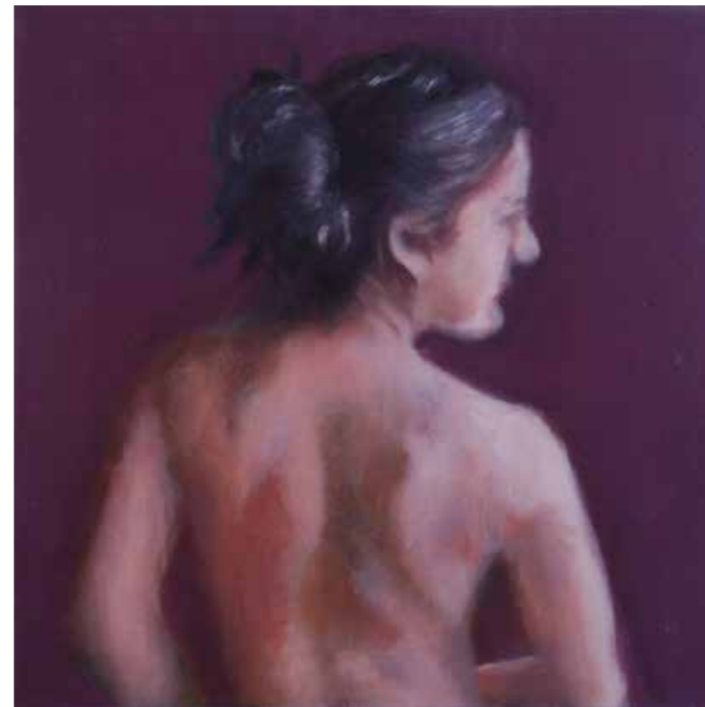
Cat. 23 Liliana Ang Torso no. 9 2008 Acrílico sobre tela 60 x 60 cm