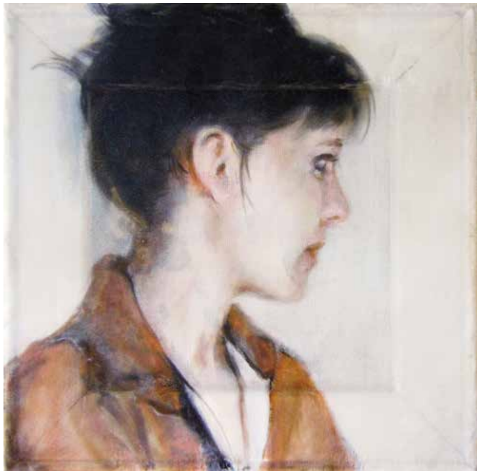
Cat. 8 Sandra del Pilar El saco chino 2015 Óleo y acrílico sobre manta y tela sintética 25 x 25 cm