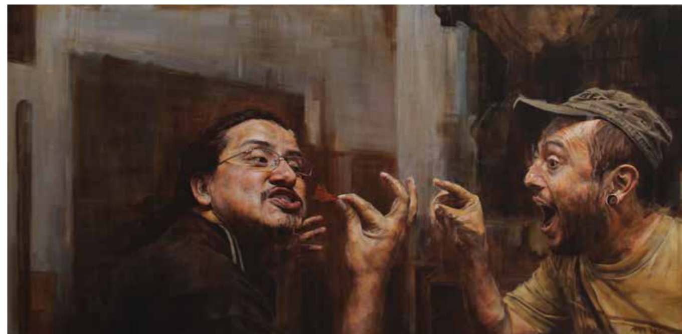
Cat. 15 Talía Yáñez Jonás y Chava 2013 Óleo sobre tela 90 x 180 cm