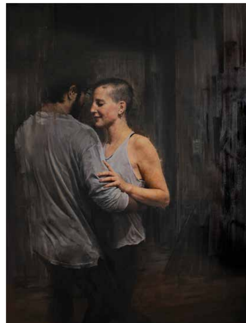
Cat. 12 Talía Yáñez 8 cm 2015 Óleo sobre tela 180 x 120 cm