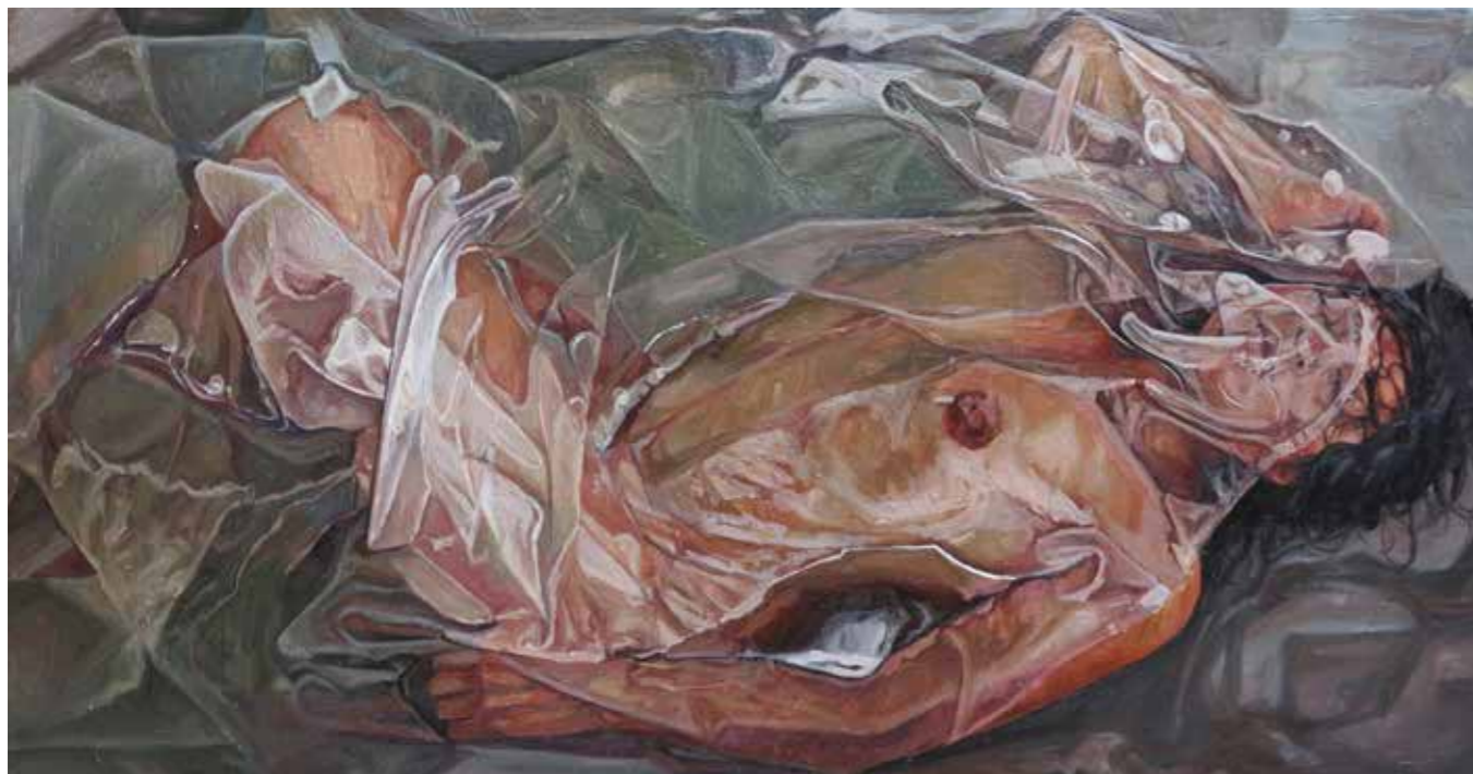
Cat. 18 Paulina Jaimes Sin título 2012 Óleo sobre tela 45 x 85 cm