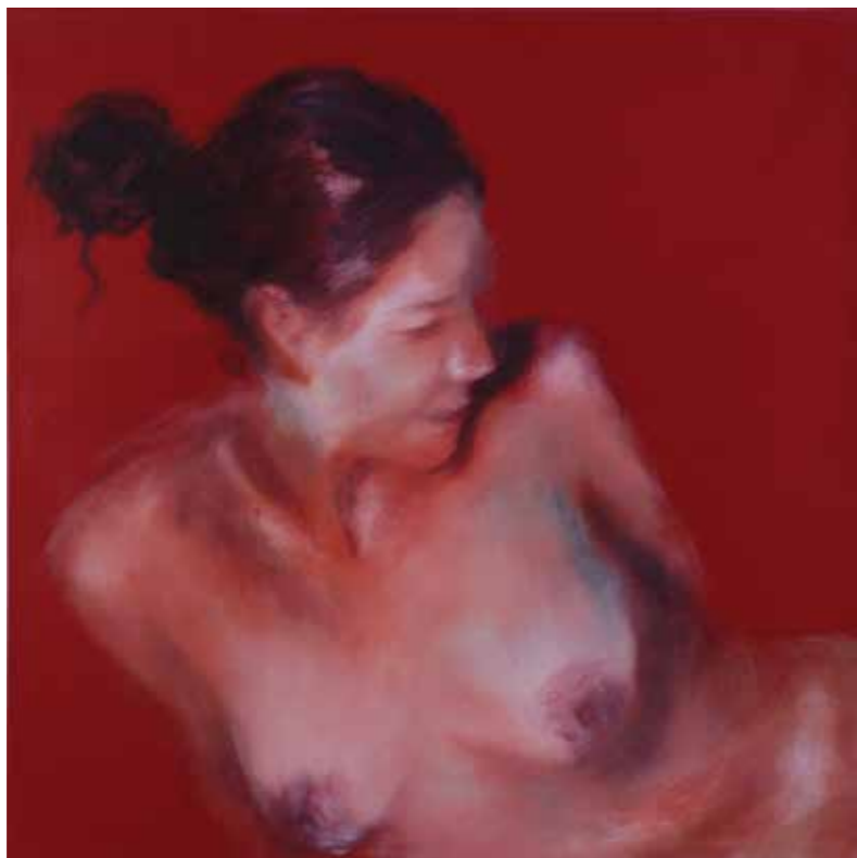
Cat. 21 Liliana Ang Torso no. 5 2008 Acrílico sobre tela 60 x 60 cm