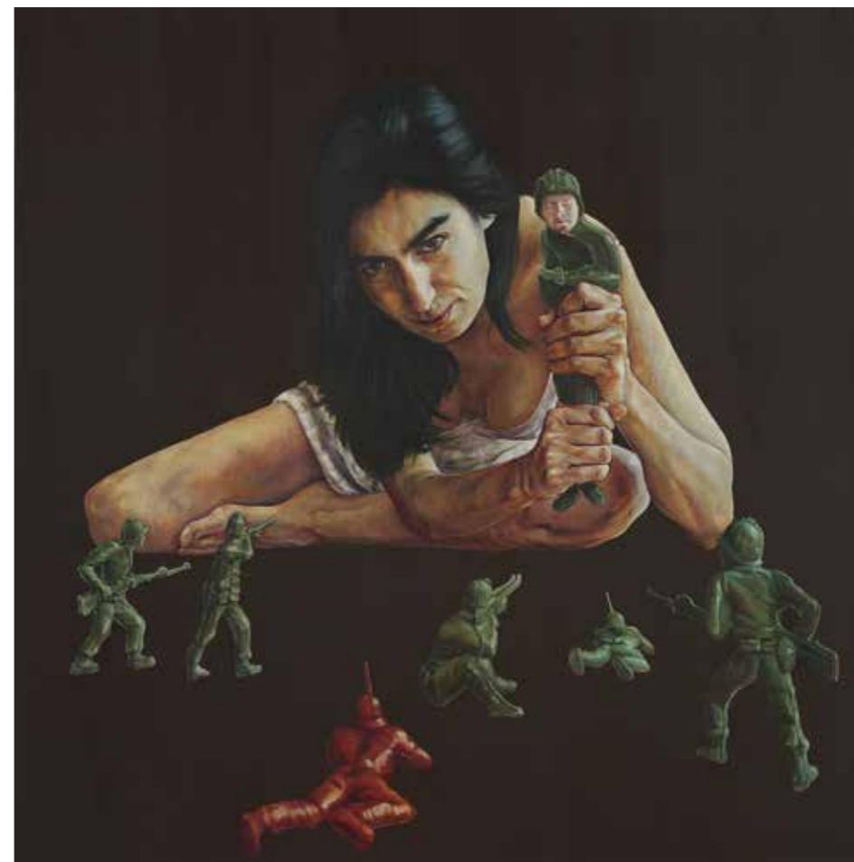
Cat. 5 Carmen Chami Leona Vicario como pretexto 2010 Óleo sobre tela 120 x 120 cm