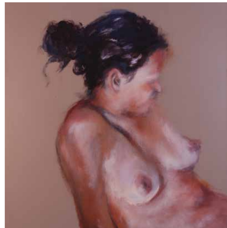
Cat. 22 Liliana Ang Torso no. 6 2008 Acrílico sobre tela 60 x 60 cm