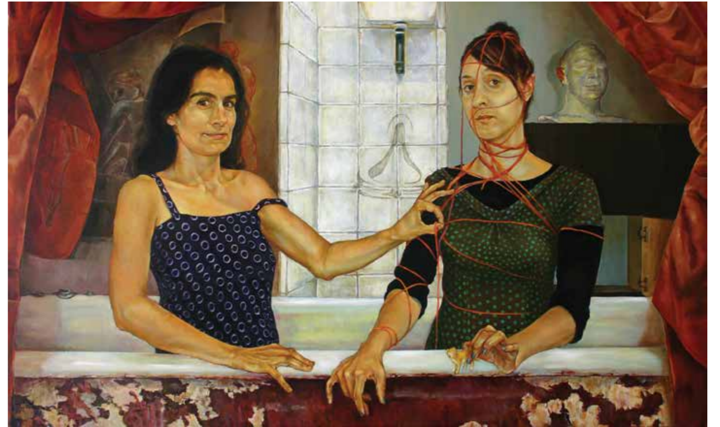
Cat. 3 Carmen Chami El baño 2011 Óleo sobre tela 90 x 150 cm