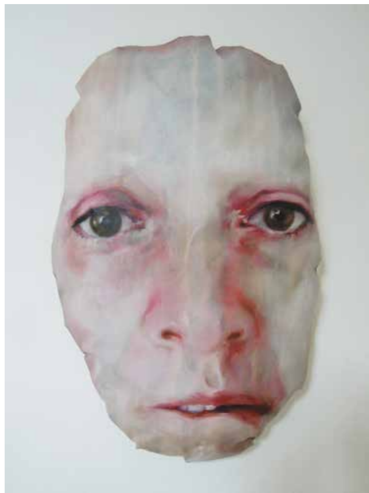
Cat. 9 Sandra del Pilar Algo me hace falta I 2014

Óleo y acrílico sobre lienzo relleno de algodón sintético 90 x 70 cm